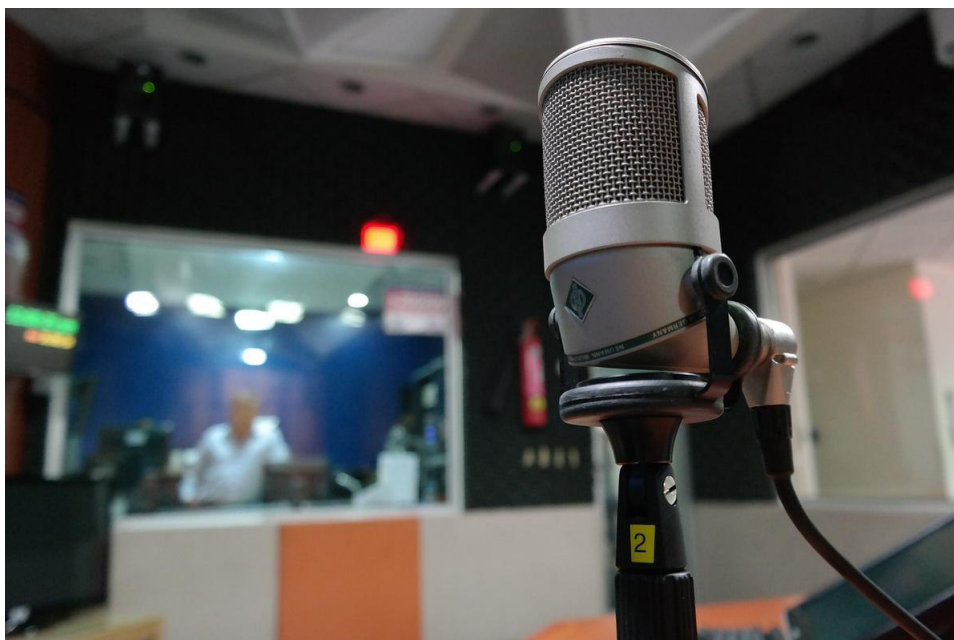
Homenagens marcam encontro internacional da ABERT em Lisboa

A abertura do encontro teve a participação do ministro das Comunicações, Juscelino Filho, que destacou a relevância do rádio. "Todos nós reconhecemos a contribuição inestimável que o rádio deu ao longo da história para a Comunicação, um simbólico abre-alas no espírito inovador e de vanguarda de todo um setor. É um meio de comunicação de massa democrático por excelência. A democracia muito deve ao rádio", afirmou o ministro.