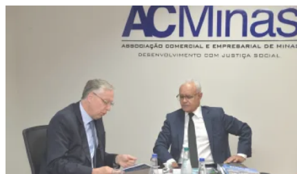
FUNCEX prevê ações conjuntas com ACMinas após assinatura de convênio 11 de abril de 2023 Em "Economia"