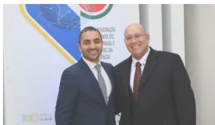
Brasil e Portugal discutiram radiofonia e comunicação em Lisboa no dia mundial do rádio 16 de fevereiro de 2023 Em "Acontece"